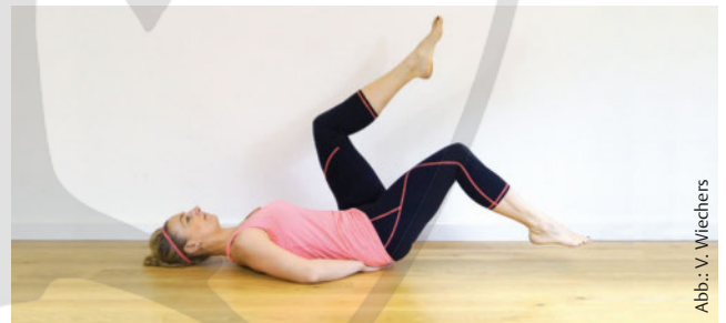
Abb.: V. Wiechers

Ausgangsposition: Rückenlage, Beine gebeugt in der Luft, Hände oder ein kleines Kissen unter das Kreuzbein legen (um Abstand zwischen Lendenwirbelsäule und Boden zu verhindern), Beckenboden intensiv anspannen, Bauchnabel erst nach innen, dann nach oben aktivieren und damit die Bauchmuskulatur fest und flach machen