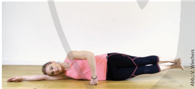
Abb.: V. Wiechers

Ausgangsposition: Seitenlage, Faust vor dem Oberkörper stützen, Schulter vom Ohr entfernen, Fußsohlen übereinanderlegen, Beckenboden intensiv anspannen, dann den Bauchnabel nach innen oben aktivieren, bis der Bauch flacher wird