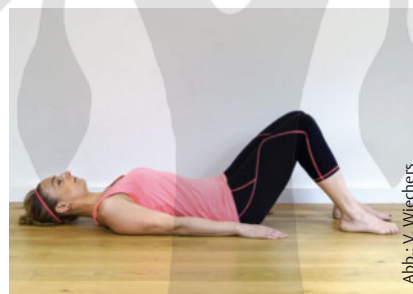
Abb.: V. Wiechers

Ausgangsposition: Rückenlage, Beine aufgestellt, Becken neutral, Hals lang, Kiefer entspannt